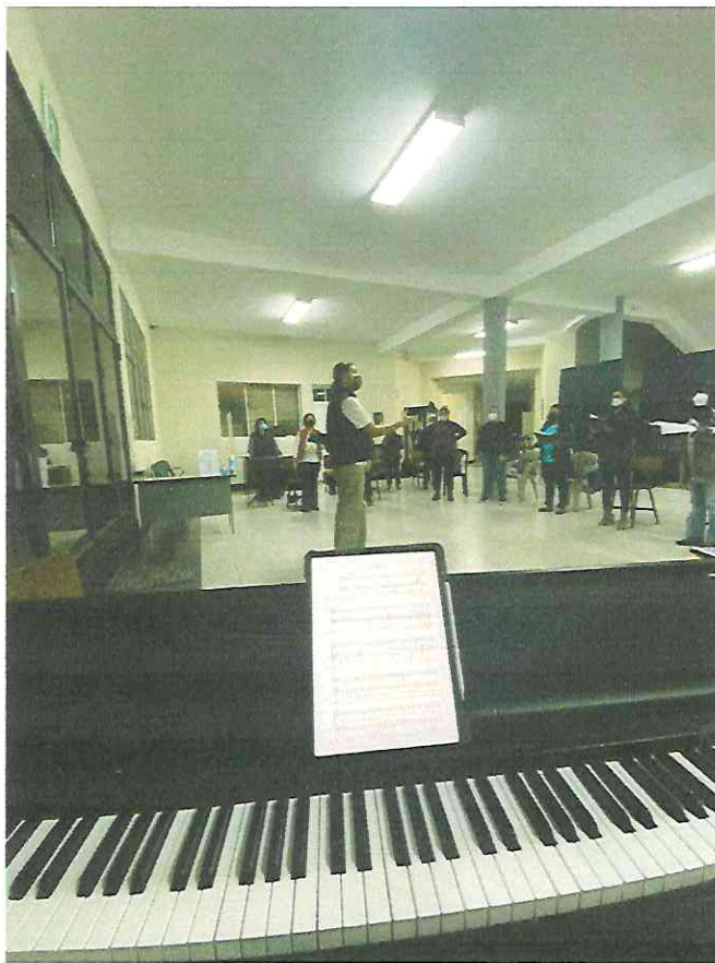
Ensayos grupales y seccionales de Temporada Popular